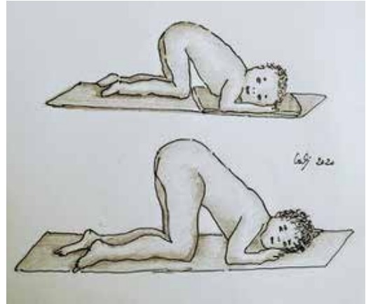
Figura 2. Posición genupectoral.