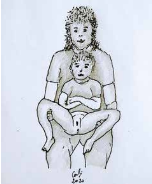
Figura 1. Posición piernas de rana.