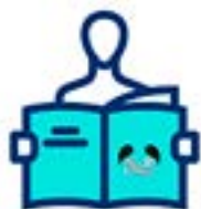
REV. EMERGENCIAS PEDIÁTRICAS