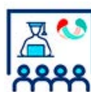
CURSOS DIGITALES Y PRESENCIALES