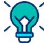
JUEGOS DE SIMULACIÓN

Superadas las limitaciones para actividades presenciales impuesta por la pandemia COVID-19, SEUP ha querido continuar desarrollando actividades científicas en formato digital . Consideramos que la educación en formato digital ha llegado para quedarse y complementar, no sustituir, a las actividades docentes presenciales. Nuestra intención es programar un seminario online con periodicidad semestral y un Encuentro Digital anual con un programa propuesto desde la Junta Directiva y los Grupos de Trabajo.