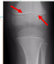
Rx de rodilla: líneas blancas de Fraenkel (flechas rojas)

Hemocultivos x 2 (sin rescate de germen) Hemograma: sin citopenias ni leucocitosis Hisopado SARS-COV 2 no detectable Laboratorio para descartar síndrome de lisis tumoral dentro de parámetros normales