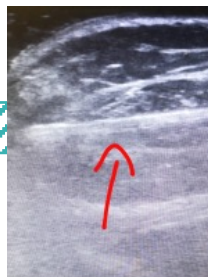
Ecografía: imagen hiperecogénica