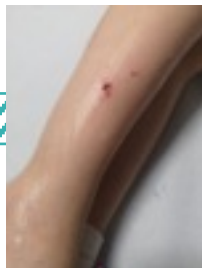
Pequeña herida en región anterior

Introducción: La ecografía de partes blandas en Urgencias Pediátricas permite una primera aproximación diagnóstica para la valoración de lesiones locales (adenitis, celulitis, abscesos) y complicaciones asociadas; localización de cuerpos extraños; valoración pre y post reducción de fracturas óseas, etc. Es un excelente complemento de una adecuada anamnesis y exploración física del paciente.