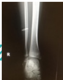
Rx: imagen radioopaca