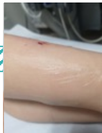
Hematoma en región posterior