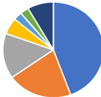
TIPO DE PATOLOGÍA

■ NEUROLÓGICO ■ TRAUMATOLÓGICO ■ RESPIRATORIO ■ INFECCIOSO ■ ENDOCRINOLÓGICO ■ PSIQUIÁTRICO-TOXICOLÓGICO