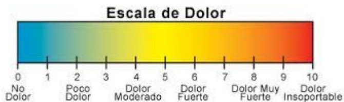
Figura 2: Escala numérica de valoración del dolor

Otra diferente es la Escala numérica de valoración del dolor (EVA). Es una línea recta numerada del 1 al 10; el número 1 es la ausencia de dolor y el 10 el mayor dolor posible. También está la variación de colores que para niños entre 3-7 años puede ser más útil (Figura 2).